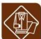
Têxtil, confección e pel