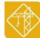
Edificación e obra civil