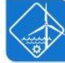
Enerxía e auga