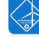
Energía e auga