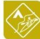
Actividades físicas e deportivas