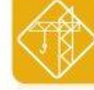
Edificación e obra civil