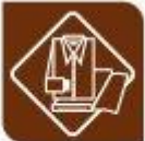
Téxtil, confección e pel