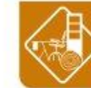
Madeira, moble e cortiza